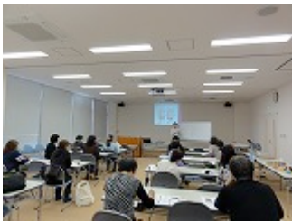
第1回講演とワークの様子