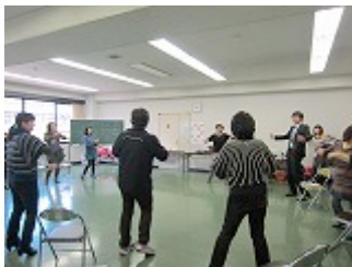
第3回講演とワーク「振り振りグッパ体操」の様子

音結会員メンバーは、対人援助者に関する学びをテーマとして、2010年「対人援助者のための講演とワーク」2011年「介護予防に向けてコ・メディカルによる講演と、音楽療法士とのジョイントワーク」を経て、2012年「介護予防のための講演とワーク」を開催出来た事、嬉しく思っております。