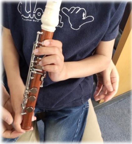
♪ 少しずつ手や指がリコーダーに馴染んできました！