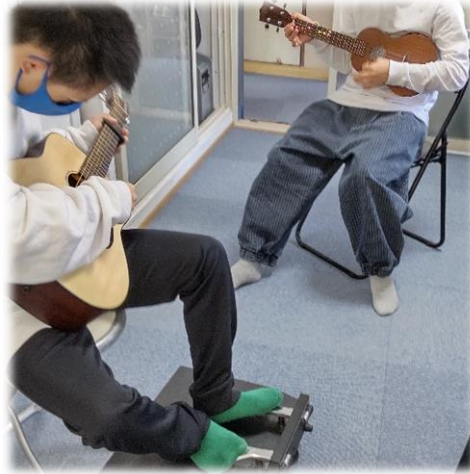
♪ アンサンブル練習中 「On the Sunny Side of the Street」