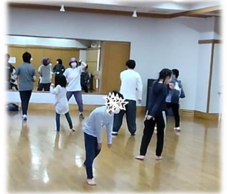
♪ ダンスレッスン ツバメ、ブラザービート、即興ダンス みんなノリノリ！