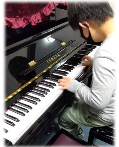
♪ 自由な発想で興演演奏