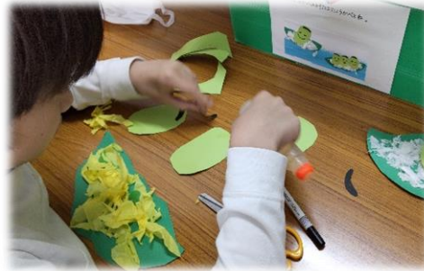
♪ 手順書を見てサクサク作成中