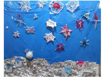
2月壁画アート「雪の結晶」

令和5年度も、お子様の得意な事・好きな事に寄添いながら、心の栄養を補給できる場にしていきます。4月から、木曜日も開所します。今年度も、どうぞよろしくお願い致します。